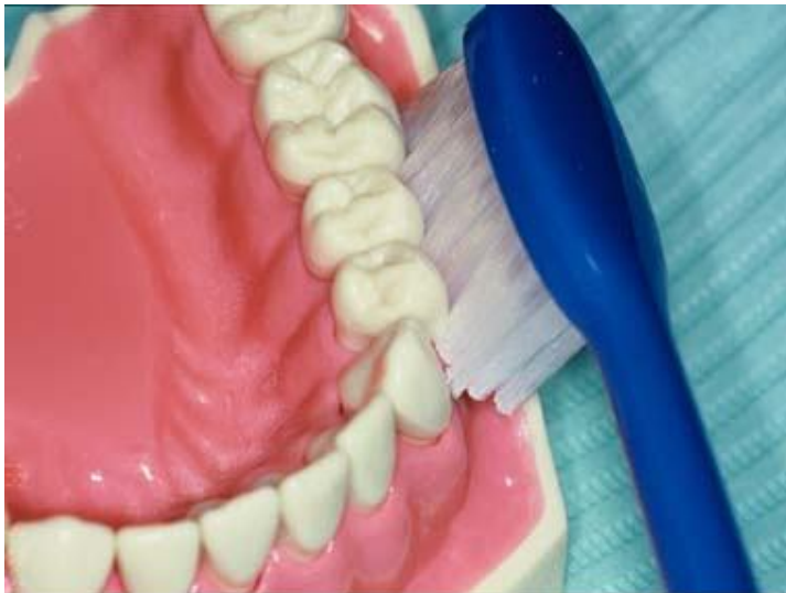
Orientation de la brosse à dents à 45° à cheval sur les dents et la gencive

De récentes études ont démontré que la plaque bactérienne constitue un bio-film qui va se loger contre la surface dentaire sous la gencive, et qu'elle est nourrie par la plaque bactérienne qui se développe sur l'émail.