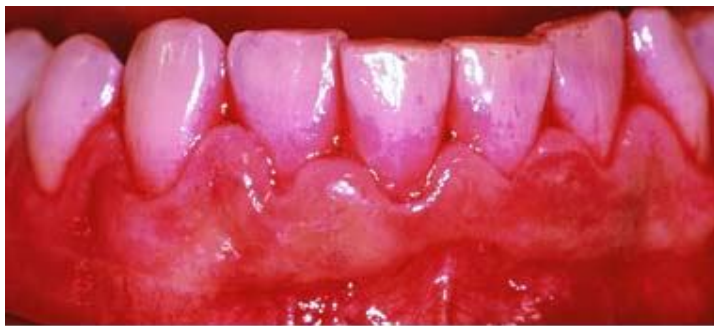
Révélateur de plaque