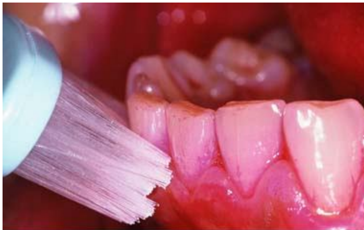
Orientation de la brosse à dents à 45° à cheval sur les dents et la gencive

Quelque soit l'âge, il est donc fondamental pour notre bien-être et notre santé générale, d'assurer une hygiène bucco-dentaire correcte, et celle-ci dépend essentiellement de notre propre motivation même si les chirurgiens-dentistes sont là pour nous informer et nous soigner.