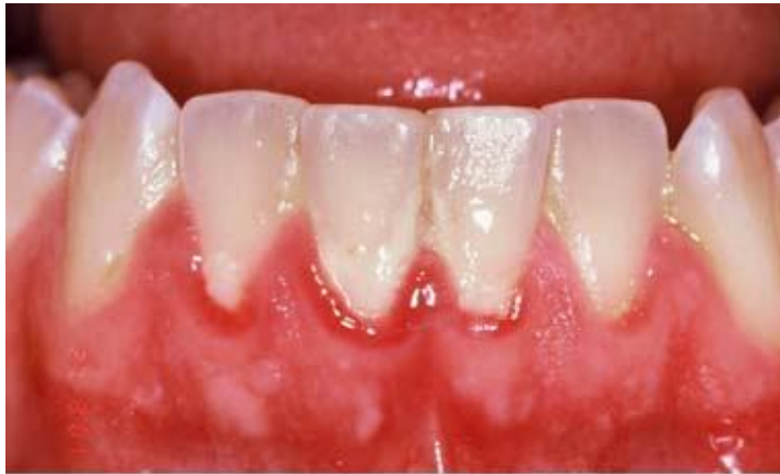
Plaque bactérienne + Inflammation gingivale